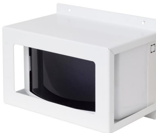
Рисунок 3 - Общий вид извещателя, защищенного кожухом

Общий вид извещателя, защищенного кожухом, показан на рисунке 3.