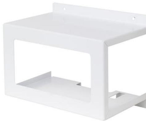
Рисунок 1 - Общий вид защитного кожуха

1.2 Общий вид защитного кожуха показан на рисунке 1.